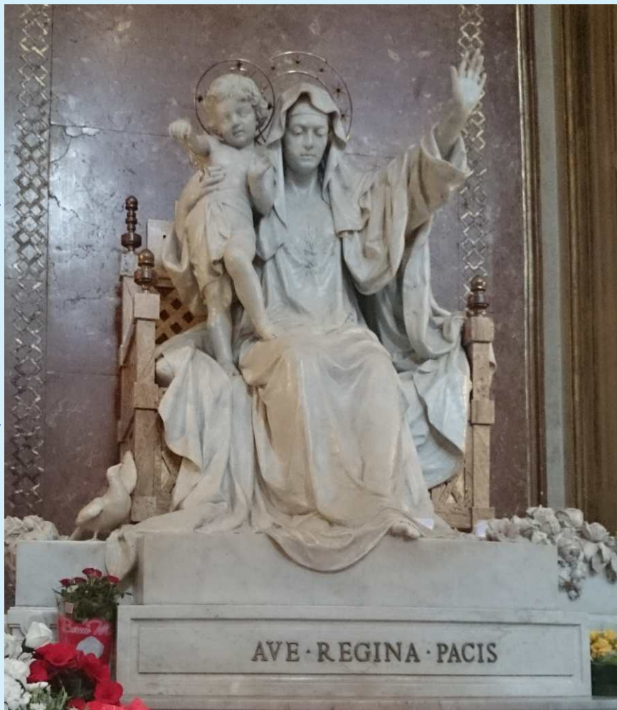
Statue Regina pacis | Santa Maria Maggiore | Rom

Maria, unsere Königin des Friedens, sie weist uns hin auf Jesus Christus. Sie ist Mensch wie du und ich, durch ihre Glaubensstärke, ihren Glaubensmut, ist sie uns Vorbild gelingenden Lebens, das sich Bahn bricht hinein in unsere Welt.