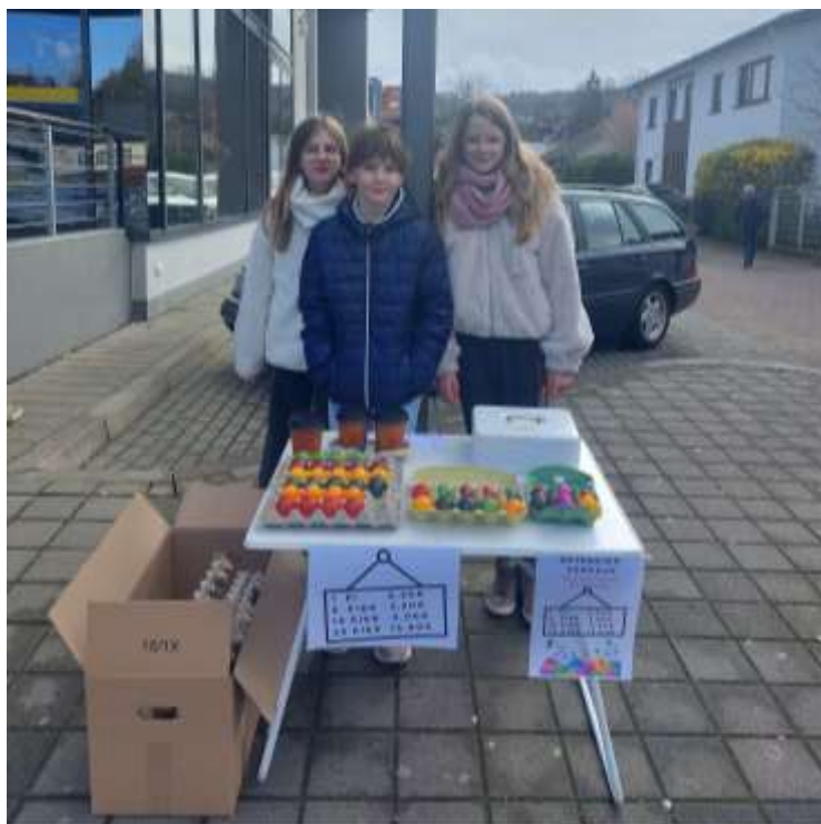
Rückblick Ostereierverkauf der Marpinger Messdiener*innen